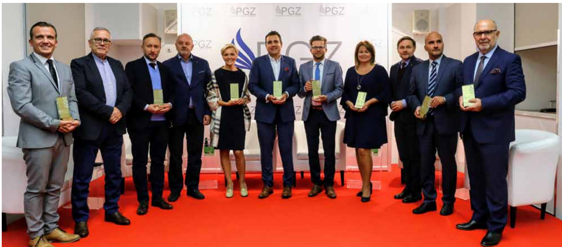
Laureaci VIII edycji konkursu Pracodawca Godny Zaufania