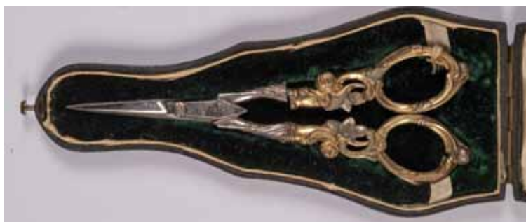
KOLEKCJA MACIEJA RADZIWIŁŁA PERU NOŻYCZKI